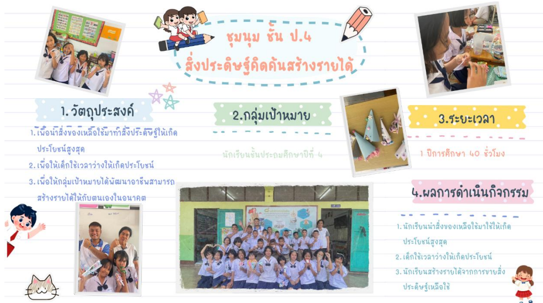
ภาพ : การจัดกิจกรรมชุมนุมชั้นประถมศึกษาปีที่ ๔ สิ่งประดิษฐ์คิดค้นสร้างรายได้

๒) ระดับประถมศึกษาตอนปลาย (ชั้นประถมศึกษาปีที่ ๔ - ชั้นประถมศึกษาปีที่ ๖) มุ่งเน้นการใช้ความคิดสร้างสรรค์ การนำวัสดุเหลือใช้มาเพิ่มมูลค่า และงานฝีมือที่ใช้ความประณีต ประกอบด้วย ชั้นประถมศึกษาปีที่ ๔ ชุมนุมสิ่งประดิษฐ์คิดค้นสร้างรายได้ ชั้นประถมศึกษาปีที่ ๕ ชุมนุมกุหลาบแทนใจ และชั้นประถมศึกษาปีที่ ๖ ชุมนุมสีสันทนแผ่นเฟรม นำไปสู่การสร้างสรรค์ชิ้นงานที่จะสามารถนำมาเป็นของที่ระลึกหรือของแทนใจให้กับคนอื่นๆ ได้