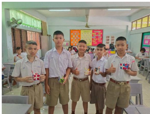
กิจกรรมชุมนุม สีสันบนแผ่นเฟรม ชั้นประถมศึกษาปีที่ ๖