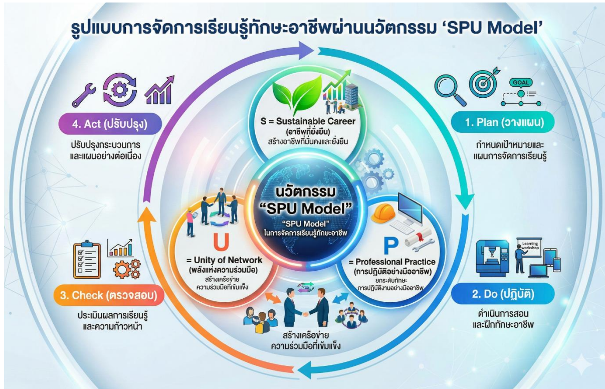
ภาพ : รูปแบบการจัดการเรียนรู้ทักษะอาชีพผ่านนวัตกรรม “SPU Model”

๔) Act (ปรับปรุง) นำผลการประเมินและข้อเสนอแนะมาปรับปรุงกระบวนการจัดการเรียนรู้ และพัฒนาผลิตภัณฑ์ให้มีความทันสมัย สามารถตอบโจทย์ผู้บริโภคและจำหน่ายได้จริง ซึ่งนำไปสู่การสร้างอาชีพที่มั่นคง มีรายได้เสริม และพึ่งพาตนเองได้อย่างยั่งยืน