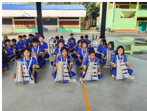
กิจกรรมชุมนุม ศิลปะ ดนตรีเพื่ออาชีพ ชั้นมัธยมศึกษาปีที่ ๓