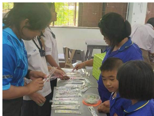
กิจกรรมชุมนุม ร้อยลูกปัดสร้างอาชีพ ชั้นประถมศึกษาปีที่ ๓