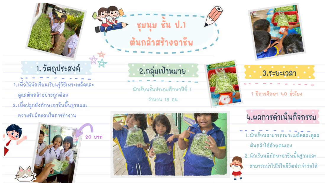
ภาพ : การจัดกิจกรรมชุมนุมชั้นประถมศึกษาปีที่ ๑ ต้นกล้าสร้างอาชีพ