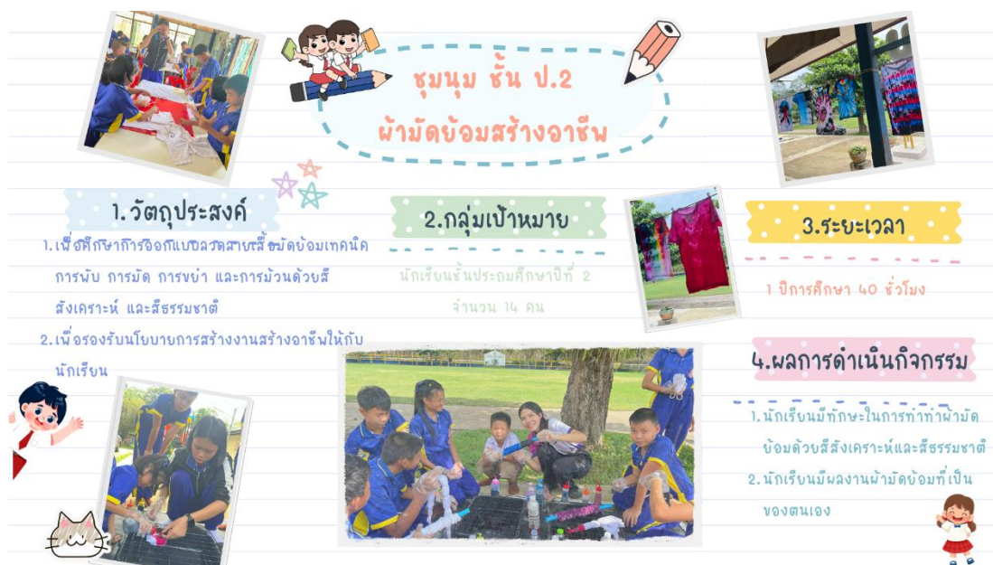
ภาพ : การจัดกิจกรรมชุมนุมชั้นประถมศึกษาปีที่ ๒ ผ้าผัดย้อมสร้างอาชีพ