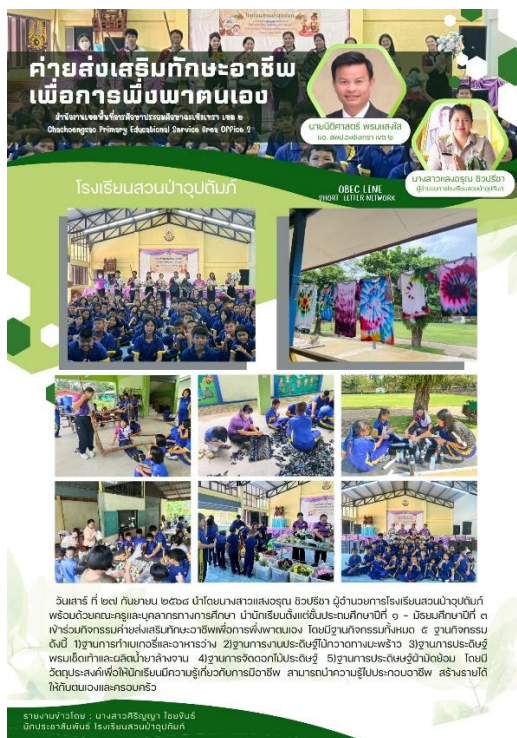
ภาพ : การเผยแพร่ค่ายส่งเสริมทักษะอาชีพเพื่อการพึ่งพาตนเอง