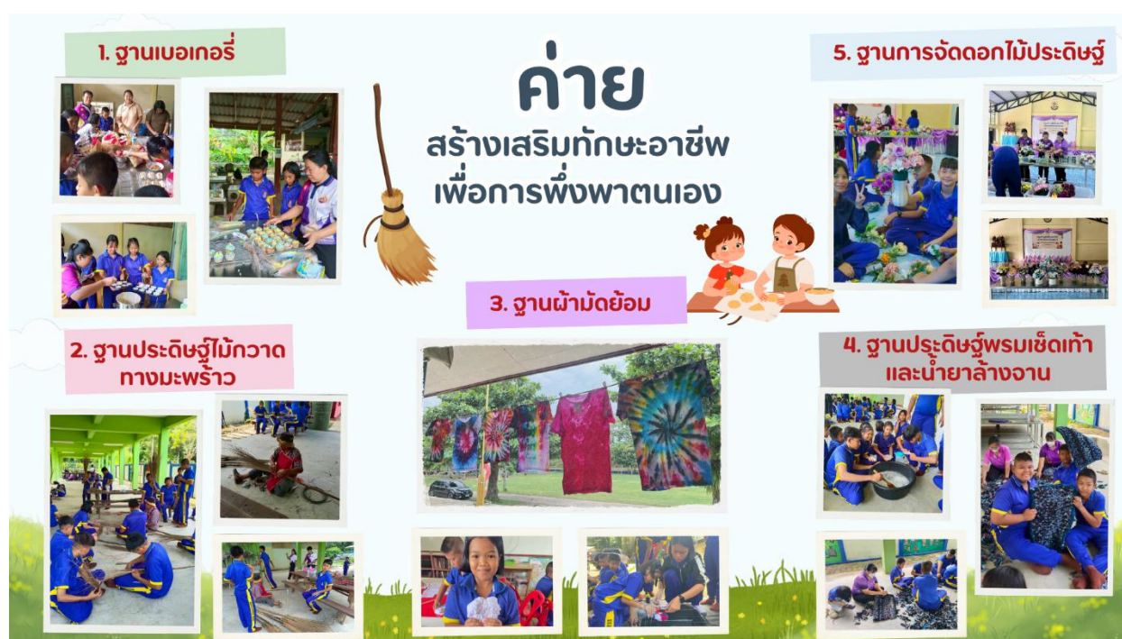
ภาพ : ค่ายสร้างเสริมทักษะอาชีพเพื่อการพึ่งพาตนเอง

ต้องการของตลาดในเทศกาลต่างๆ ได้รับความร่วมมือจาก กรมส่งเสริมการเรียนรู้ (สกร.) สนามชัยเขต มาเป็นวิทยากร สอนเทคนิคต่างๆ ให้กับนักเรียน