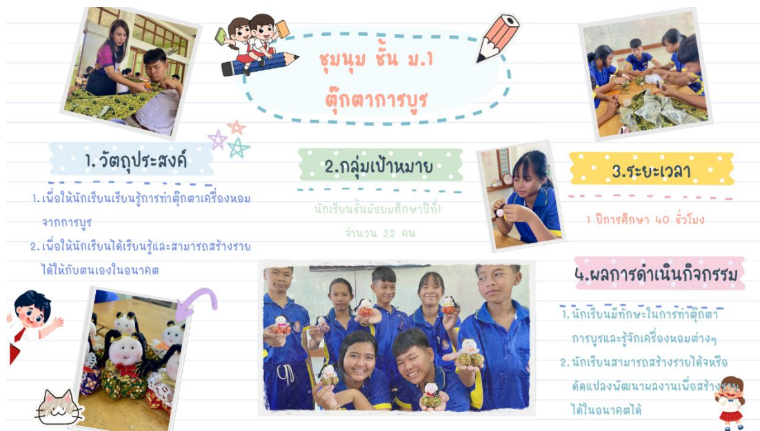
ภาพ : การจัดกิจกรรมชุมนุมชั้นมัธยมศึกษาที่ ๑ ตุ๊กตาการบูร