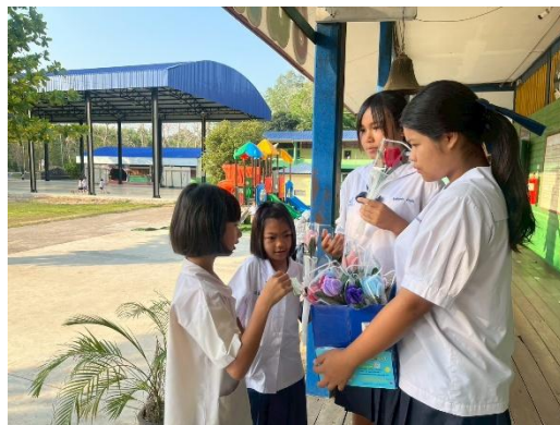
กิจกรรมชุมนุม ลวดกำมะหยี่ ชั้นมัธยมศึกษาปีที่ ๒