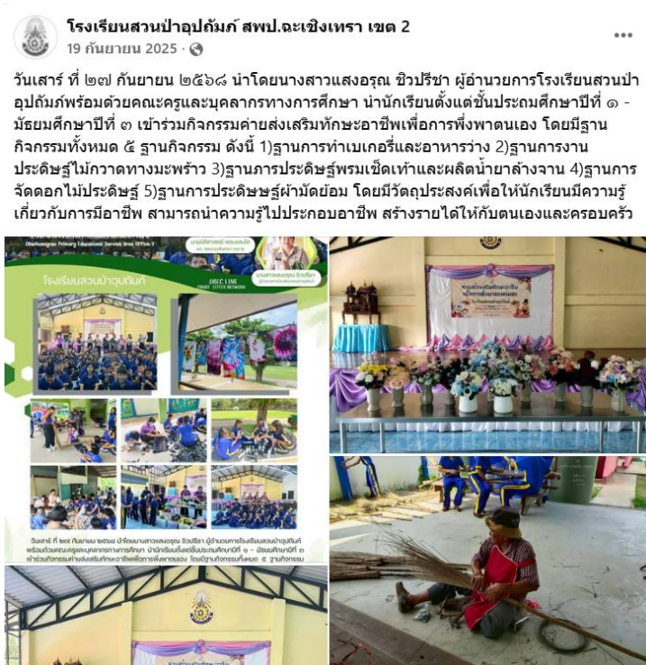
ภาพ : การเผยแพร่การดำเนินงานค้าส่งเสริมทักษะอาชีพเพื่อการพึ่งพาตนเอง

๗.๑.๑ เผยแพร่ภาพกิจกรรมและผลงานผลิตภัณฑ์ของนักเรียนผ่านหน้าแฟนเพจ Facebook ของโรงเรียนสวนป่าอุบลรัตน์