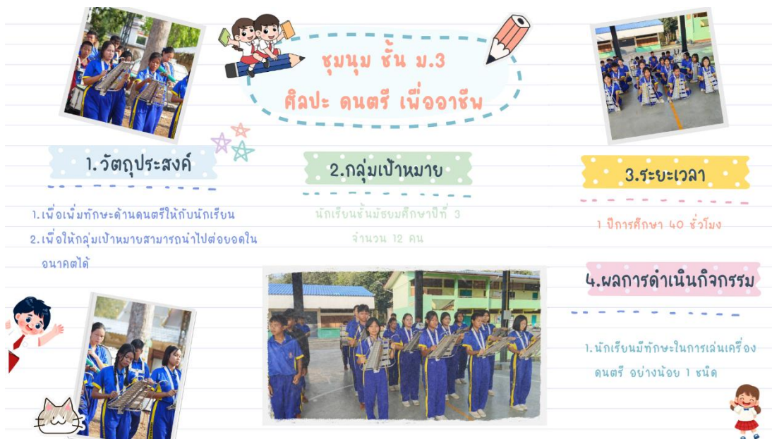
ภาพ : การจัดกิจกรรมชุมนุมชั้นมัธยมศึกษาที่ ๓ ศิลปะ ดนตรี สร้างอาชีพ

ส่งเสริมทักษะอาชีพ โดยสถานศึกษาได้ดำเนินกิจกรรม "ค่ายสร้างเสริมทักษะอาชีพเพื่อการพึ่งพาตนเอง" โดยแบ่งฐานการเรียนรู้เชิงปฏิบัติการออกเป็น ๕ ฐาน เพื่อให้นักเรียนได้ค้นพบความถนัดที่หลากหลาย ดังนี้