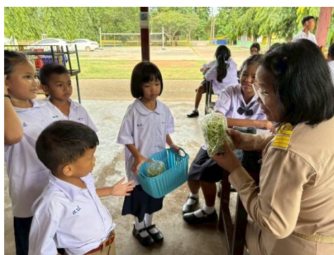
กิจกรรมชุมนุม ต้มก๋วยเตี๋ยวสร้างอาชีพ ชั้นประถมศึกษาปีที่ ๑