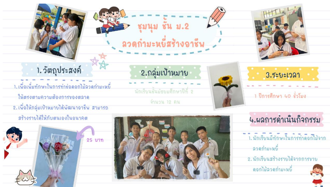
ภาพ : การจัดกิจกรรมชุมนุมชั้นมัธยมศึกษาที่ ๒ ลวดกำมะหยี่สร้างอาชีพ