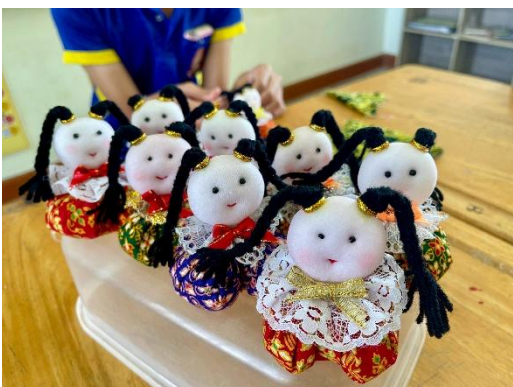
กิจกรรมชุมนุม ตุ๊กตาการบูร ชั้นมัธยมศึกษาปีที่ ๑