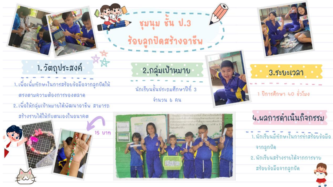
ภาพ : การจัดกิจกรรมชุมนุมชั้นประถมศึกษาปีที่ ๓ ร้อยลูกปัดสร้างอาเซียน

๒) ระดับประถมศึกษาตอนปลาย (ชั้นประถมศึกษาปีที่ ๔ - ชั้นประถมศึกษาปีที่ ๖) มุ่งเน้นการใช้ความคิดสร้างสรรค์ การนำวัสดุเหลือใช้มาเพิ่มมูลค่า และงานฝีมือที่ใช้ความประณีต ประกอบด้วย ชั้นประถมศึกษาปีที่ ๔ ชุมนุมสิ่งประดิษฐ์คิดค้นสร้างรายได้ ชั้นประถมศึกษาปีที่ ๕ ชุมนุมกุหลาบแทนใจ และชั้นประถมศึกษาปีที่ ๖ ชุมนุมสีสันทนแผ่นเฟรม นำไปสู่การสร้างสรรค์ชิ้นงานที่จะสามารถนำมาเป็นของที่ระลึกหรือของแทนใจให้กับคนอื่นๆ ได้